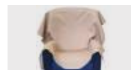
GRAN FOULARD dimensioni 150x140 cm.