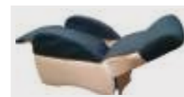
KIT completo copri schienale e seduta (pezzo unico) + copri braccioli