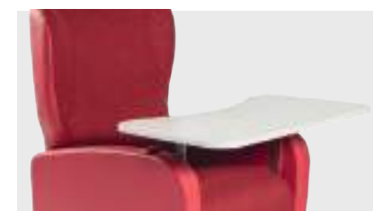
TAVOLINO CON STAFFE applicabile a tutti i modelli di poltrona consente di appoggiare comodamente le braccia ai braccioli