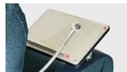
TAVOLINO SNODABILE Ruotabile di 360°, inclinabile di 45°, base fissa.

Per il tablet o per lettura di riviste nell'ambito domestico.