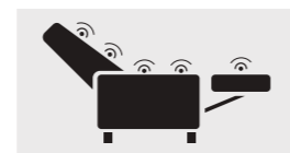
VIBROMASSAGGIO con 5 punti di massaggio