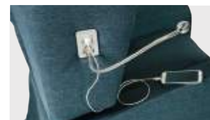
KIT LUCE + USB applicabile ai seguenti modelli: Nadia, Nadia Professional, Ambra Professional, Nicole e Nicole Small