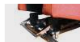
ROLLER SYSTEM premendo una barra posta nella parte inferiore della struttura, è possibile lo spostamento della poltrona con "persona a bordo" Non adatto ai modelli Nicole Small e Betty XL3