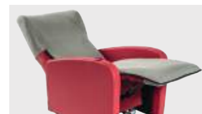
COPRIPOLTRONA P.A. Technology che consente la circolazio- ne dell'aria, la dissipazione del calore e la termoregolazione

Applicabile ai seguenti modelli: Nadia, Ambra Professional, Nicole e Nicole Small