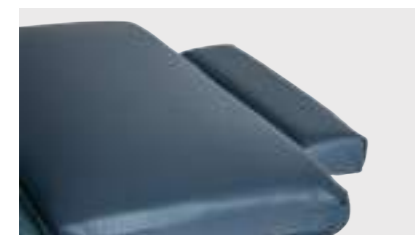
PEDIERA ESTENSIBILE 7 CM