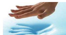
MEMORY FOAM per una migliore distribuzione del peso e una riduzione della pressione da contatto